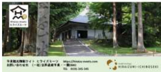
平泉観光情報サイト「ヒライズミーツ」 https://hiraizu-meets.com お問い合わせ先 (一社)世界遺産平泉・一関 DMO TEL 0191-345-345