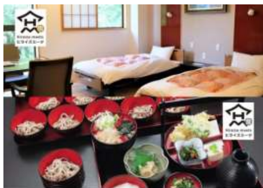
平泉の人・宿・食・景色に出会うサイト